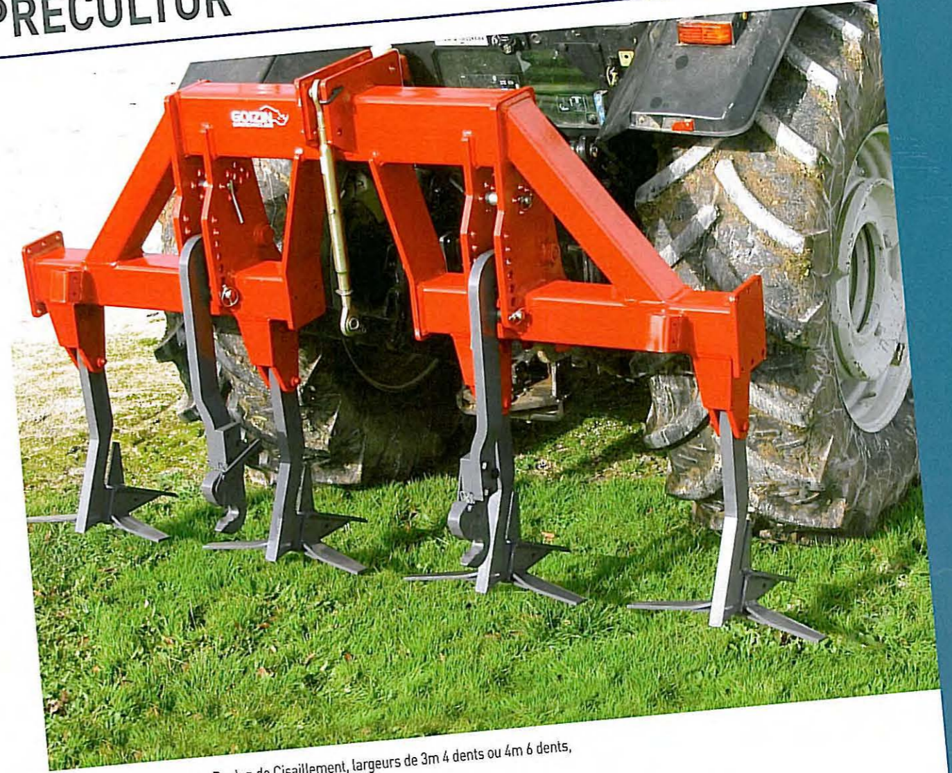
• PRECULTOR Sécurité par Boulon de Cisaillement, largeurs de 3m 4 dents ou 4m 6 dents,