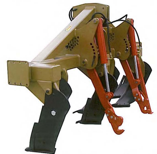
• L'attelage arrière optionnel permet l'accrochage d'un outil complémentaire, sans aucun démontage. Il peut être à commande hydraulique ou flottant avec butées à broches.