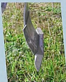
• Pointe réversible à étrave indépendante. COMBILAB 600