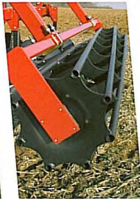
• Simple rouleau tubes ronds Ø 500 / 8 tubes