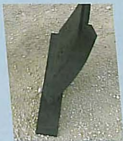
• Pointe à étrave renforcée, monobloc. COMBILAB 600