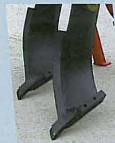
• Pointe carbure à étrave indépendante. COMBILAB 800