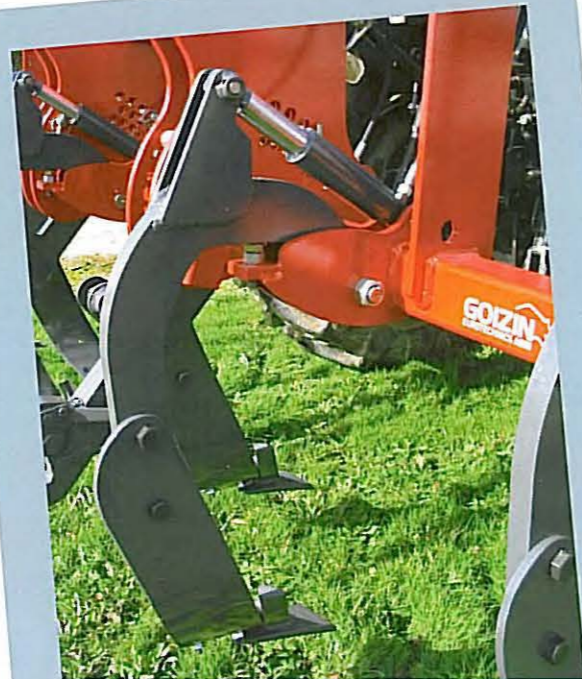
• COMBILAB 600 NSH 3m 6 lames