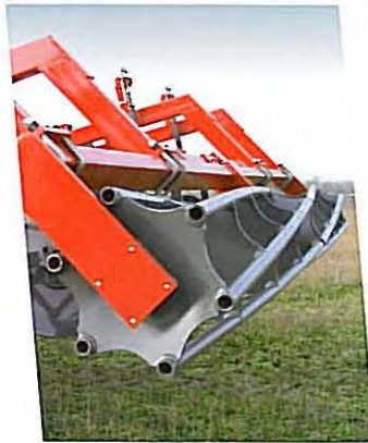
• Simple rouleau tubes ronds Ø 400 / 6 tubes