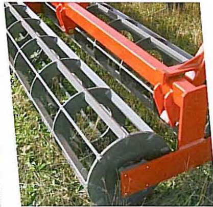
• Simple rouleau barres plates Ø 400 / 9 barres Ø 500 / 11 barres