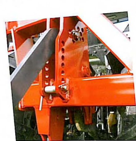
• Attelage arrière flottant à réglage par butées permettant d'ajuster la profondeur de travail de votre combiné et le porte-à-faux au transport.