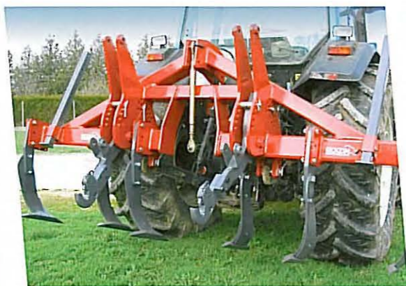
• Attelage arrière à bras flottants, réglables par butées à broches, ou par vérins hydrauliques double effet. Prévu pour un accrochage de l'outil combiné sans démontage.