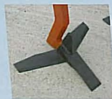
• Aileron avec coute et pointe indépendante. PRECULTOR