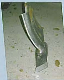
• Pointe carbure à étrave renforcée, monobloc. COMBILAB 600