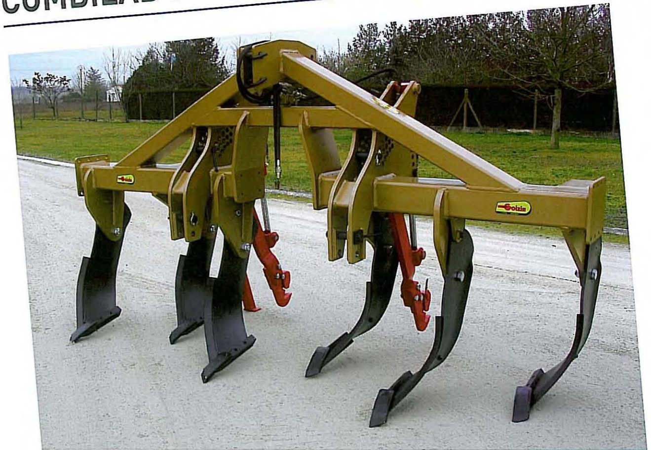
• COMBILAB 800 en largeur de 3m ou 4m, équipé de 4, 6 ou 8 lames, à Sécurité par Boulon de Cisaillement.