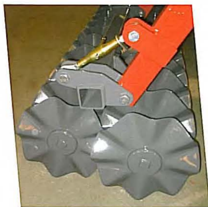
• Tandem double rouleau disques ondulés Ø 500 au pas de 235 mm.