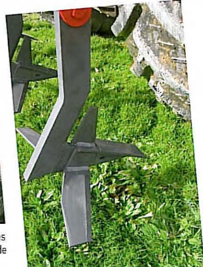
• Dents en acier haute résistance, avec aileron de 65 cm de large et pointe, interchangeables.