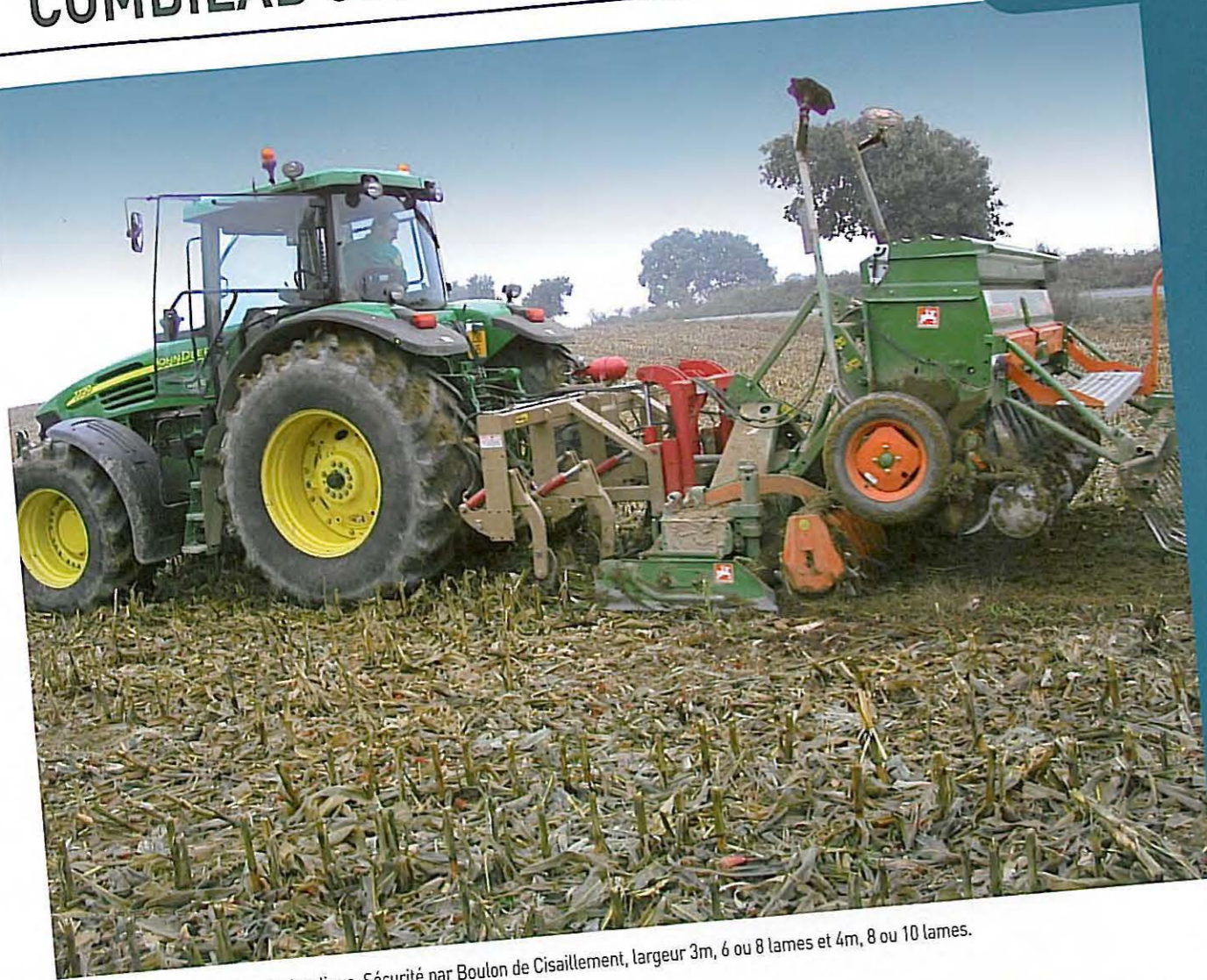
• COMBILAB 600 - Non Stop Hydraulique. Sécurité par Boulon de Cisaillement, largeur 3m, 6 ou 8 lames et 4m, 8 ou 10 lames.